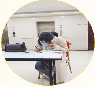
逆行记者深入“疫”线采访