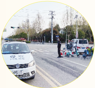
工作人员在卡口执勤