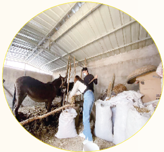
党员干部帮隔离老乡喂牲畜