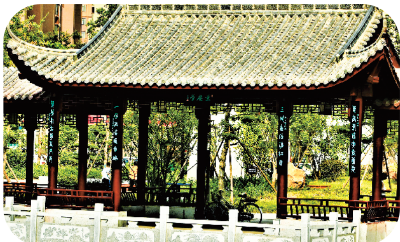
景庆亭西側。楹联:三川麦浪涌红日;一水流金映白帆。 楹联:惠露遐扬大禹崇德;英风永在关公尚义。