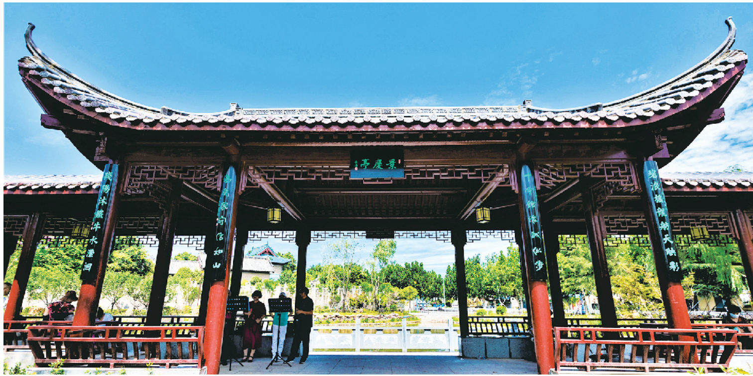
景庆亭。楹联:十会馆怀诚似海;万商家守信如山。 楹联:碧浪摇龙舫天映彩;残阳沐铁牛水漾洄。