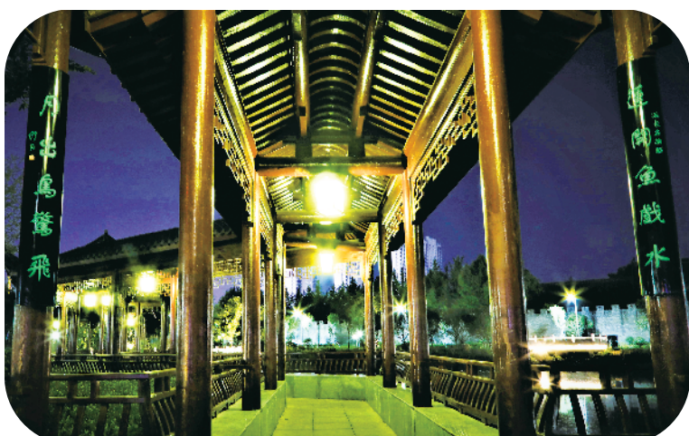
悦来亭。楹联:莲开鱼戏水;月出鸟惊飞。