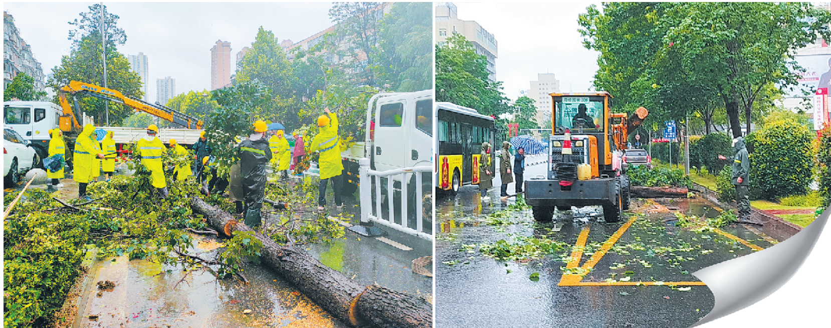
8月26日、27日,我市迎来强降雨天气。为筑牢防汛安全防线,市园林绿化中心第一时间进入应急状态,科学部署防汛工作。园林人闻“雨”而动,听令而行,加强树木倒伏、道路积水险情排查,全力确保市民出行安全,为城市安全筑牢“绿色防线”。截至8月27日12时,市园林绿化中心共出动巡查人员300余人次、巡查车辆30余台次,处理倒伏树木40余株,有效降低了极端天气给城市带来的影响。