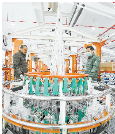
淮阳塑料制品产业园项目