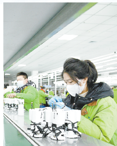
西华县海鑫电子新能源汽车精密零组件制造建设项目