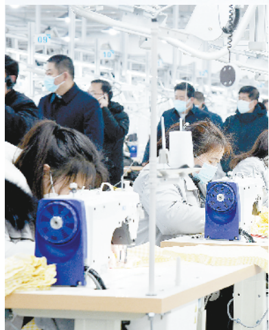
商水年产2600万件婴幼儿服装项目

12月29日,全市四季度“三个一批”重大项目建设观摩讲评活动继续进行,观摩组深入高水县、西华县、扶沟县、淮阳区、周口临港开发区、川汇区,对18个县域主导产业项目进行观摩。从观摩情况看,各县区坚持以创新驱动为导向,瞄准市场新需求和产业发展新方向,持续加大研发投入,加强技术创新,实施智能制造,推动一批高成长性企业融入产业链的关键环和价值链的中高端,为加快构建以先进制造业为支撑的现代产业体系注入新动能。