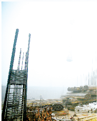
河南润融纺织天丝莱赛尔新材料产业园项目