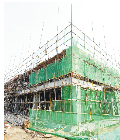
周口特鑫智能设备制造项目