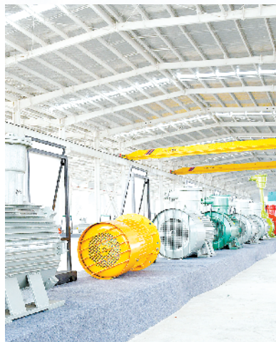
河南省承业电气年产80万KW防爆电机生产线建设项目