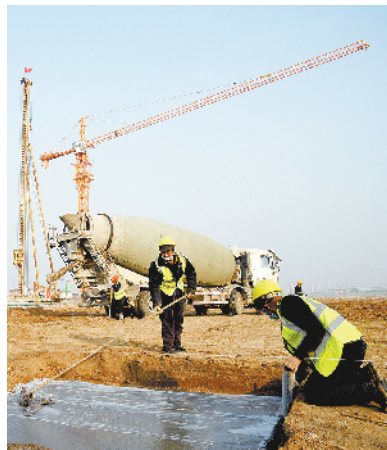
周口京东多式联运国际物流港(一期)项目