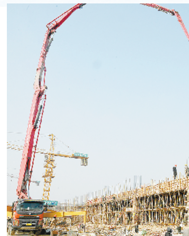
西华县耕德电子智能终端阳极氧化生产基地建设项目