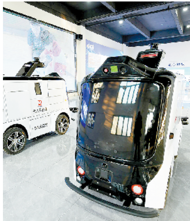
中迪无人智能科技项目