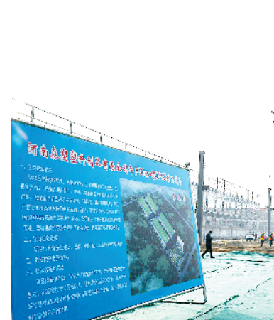
河南森塑塑料制品有限公司年产10万吨UPVC项目

该项目总投资2.6亿元,建筑面积约3.1万平方米,星宇(河南)控股有限公司将投资1千万美元入驻,总面积约2000平方米,主要研发云操作系统、云服务平台和云端运营架构,引进先进服务器、计算机等研发设备,并建设IDC机房一座,从事科技创新工作。目前,已完成投资8000万元,计划2023年12月竣工交付使用。项目建成投产后,可安排创新人才就业2000人,年均总产值达20亿元以上,全面提升企业自主研发能力和水平,为周口高新区电子信息和装备制造提供技术支撑。①6