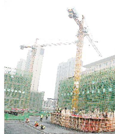
周口高新区电子信息产业园科创中心项目