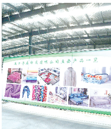
周口洋森印染有限公司年产3万吨印染布项目

该项目总投资32亿元,总建筑面积约29万平方米,主要建设框架式标准化车间、自动化手机装配间、研发中心、综合泵房等其他相关配套设施。目前,框架式标准化车间已经全部建设装修完毕,全自动生产线和其他辅助设备已经全部安装到位,预计2023年3月全部建成。项目全部建成后,可年产阳极氧化处理加工电子产品智能终端6000万个,年产值约30亿元,每年可实现利税约2亿元,安排