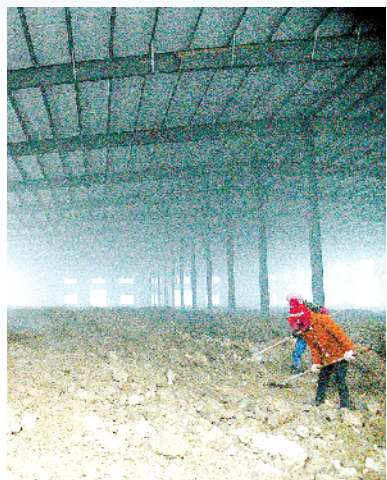
商水农副产品精深加工项目