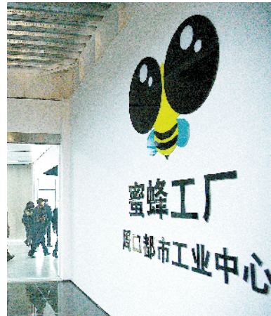
蜜蜂工厂—周口都市工业中心项目