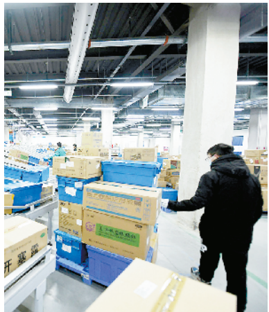
河南同和堂健康产业园项目