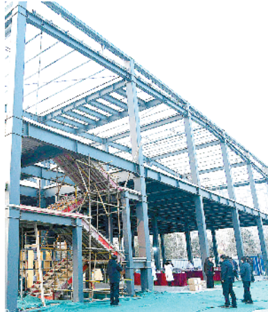
四方制药智能化改造项目中试基地项目