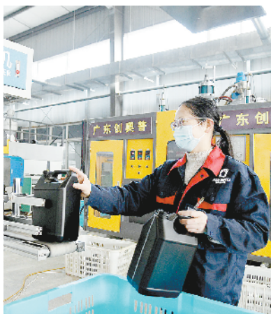
巨丰美特好汽车配件塑料制品建设项目

该项目总投资3亿元,总建筑面积5.53万平方米,主要建设标准化厂房、综合研发楼、办公楼,主要生产汽车机油壶、水壶、风管、前座椅装饰盖、风道总成(HDPE)、左右通风管总成、上下风向叶片连接杠、左右脚通风口总成等。目前,项目已经建成投产。项目全部达产后,可实现年产值6亿元,利税2500万元,安排就业人员200人以上。